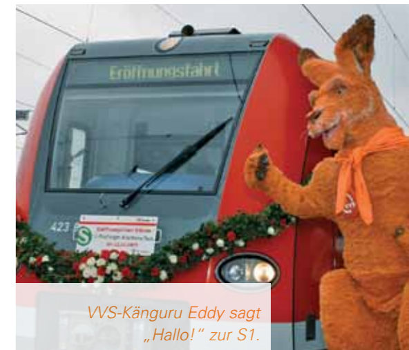
VVS-Känguru Eddy sagt „Hallo!“ zur S1.

Mit 71,5 Kilometern Länge ist die S1 von Herrenberg nach Kirchheim/Teck die längste S-Bahn-Strecke im Verbundgebiet. Nach 2001, als die S2 nach Filderstadt verlängert wurde, war das die erste Erweiterung des S-Bahn-Netzes im VVS-Gebiet. Sie wird nicht die letzte bleiben: für die Tangentialverbindungen der S60 von Böblingen nach Renningen und der S4 von Marbach nach Backnang wurden die Bauarbeiten bereits aufgenommen. Der erste Abschnitt der S60 bis Maichingen wurde Mitte 2010 in Betrieb genommen.