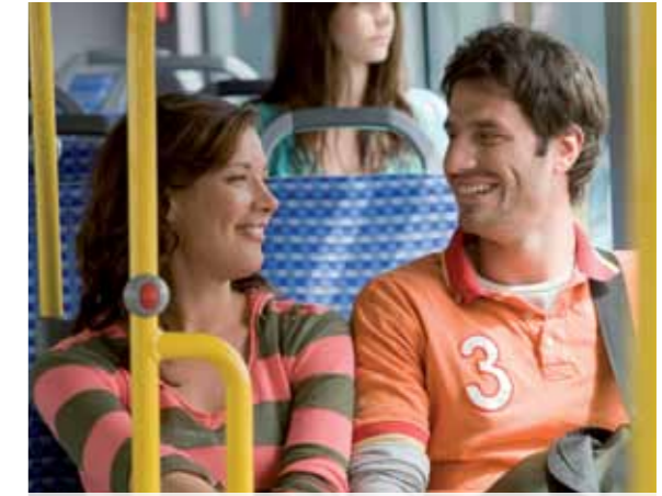
Studenten sind ab 2010 noch günstiger in der Metropolregion unterwegs.

28. September: Das Känguru wird bei der VVS-Hocketse auf dem Cannstatter Volksfest auf den Namen „Eddy“ getauft.