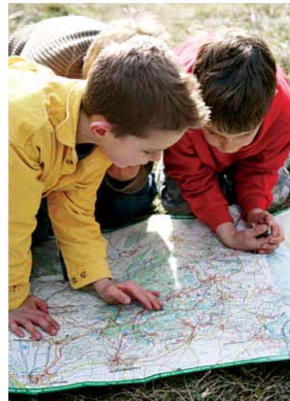
Bei der VVS-NahTour tüftelten Schüler Klassenausflüge in der Region Stuttgart aus.

„Wozu in die Ferne schweifen, wenn das Gute liegt so nah?“ – es muss nicht die teure Auslandsreise sein, denn eine Vielzahl attraktiver Ausflugsziele in und um Stuttgart herum warten darauf, entdeckt zu werden. In Zusammenarbeit mit der Regio Stuttgart Marketing- und Tourismus GmbH erarbeitete der VVS Touren durch die gesamte Region. Alle Ausflugsziele, in Broschüren zusammengefasst und ausführlich beschrieben, waren selbstverständlich mit Bus und Bahn erreichbar. Vor Ort erwartete VVS-Fahrgäste, wenn sie ihr Ticket vorzeigten, stets eine kleine Überraschung. Außerdem gab es einen VVS-Tourpass, mit dem beim Besuch der Kooperationspartner Punkte gesammelt werden konnten, um an einem Gewinnspiel teilzunehmen. Das Konzept hat sich bewährt: Neben dem „Sommersuchspiel“ gab es 2009 auch die „VVS-Ostertour“, die „VVS-WeihnachtsmarktTour“, die „BesenTour“ in Kooperation mit regionalen Besenwirtschaften und die „KulTour“, die zusammen mit regionalen Schauspielhäusern auf die Beine gestellt wurde.