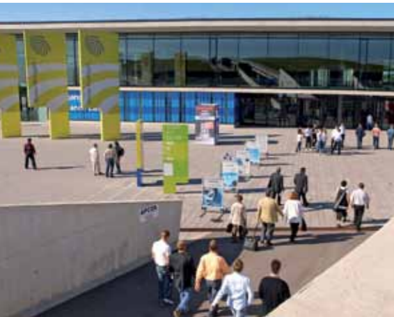
Auch bei großen Messen können Besucher auf Bus und Bahn zählen.

Die Verkehrsanbindung war eines der wichtigsten Kriterien bei der Standortentscheidung für die neue Messe. Dabei spielte insbesondere die direkte Anbindung an das S-Bahn-Netz eine große Rolle. Wegen des enormen Besucherandrangs bei den Publikumsmessen ist ein leistungsfähiges Schienenverkehrsmittel unverzichtbar. Allerdings zeigte sich bei den ersten ganz großen Messeereignissen nach der Eröffnung, dass bei der S-Bahn noch Optimierungsbedarf bestand. Der Anteil der Messebesucher, die mit Bus und Bahn anreisten, war deutlich höher als im ursprünglichen Messegutachten prognostiziert. Ohne Eingriffe in die S-Bahn-Signalsteuerung waren zunächst lediglich vier Zugpaare pro Stunde möglich. Die Nachfragespitze in der morgendlichen Anreisephase wurde damit nur mit Mühe bewältigt. Alle Beteiligten waren sich einig, dass die betriebliche Abwicklung verbessert werden musste.