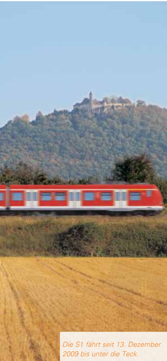
Die S1 fährt seit 13. Dezember 2009 bis unter die Teck.

Trotz Kälte und Schneeregen gab es am 12. Dezember in Kirchheim nur lachende Gesichter. Nach 30 Jahren Planung fuhr die erste S-Bahn am Bahnhof ein. Ganz ohne Umsteigen können nun rund 130.000 Bewohner im Einzugsgebiet des neuen Streckenabschnitts nach Stuttgart fahren. In weniger als einer Dreiviertelstunde erreichen sie die Stuttgarter Innenstadt. Die S-Bahn-Linie S1 fährt täglich alle 30 Minuten Richtung Stuttgart.