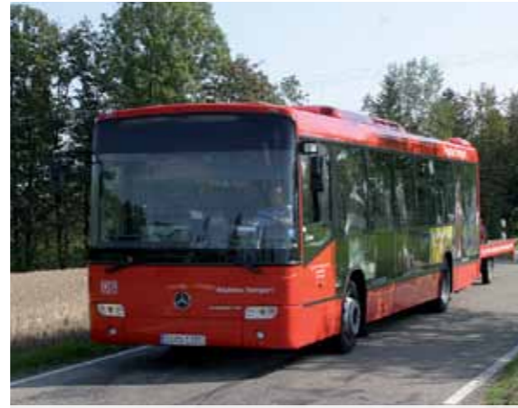
Mit dem Limesbus auf zwei Linien quer durch den Schwäbischen Wald.

März: Nach mehr als 20 Jahren hat sich das VVS-Kundenmagazin NEVVS vom A5-Format verabschiedet. Jetzt präsentiert der VVS seinen Fahrgästen aktuelle Themen im Zeitungslayout im Format A3.